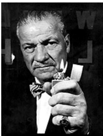
George Blaisdell-pan Zippo.

5.6x3.6x1.1cm,60 gramů-22součástek z niklu a tvrzené ocele a jednoduché ovládání-to je Zippo