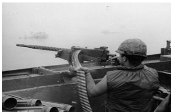
Vylepšená verze MK21 používaná ve Vietnamu

JEDNA Z NEJSLAVNĚJŠÍCH A NEJDÉLE SLOUŽÍCÍCH ZBRANÍ V US ARMY 50cal.(12.7m) byl vyvinut na konci první sv..války a slouží v podstatě nezměněný do 21 století.Po řadě dříve chlazených vodou.letadlové a tankové modely byla testována vylepšená verze v r.1933 M2 .Po dobu WW2 bylo vyrobeno téměř 2.mil.kusů až do r.1946. M 50-je automaticky po odrazu výstřelu posuvný,znovu nabíjecí zbraň,vzduchem chlazený,pro