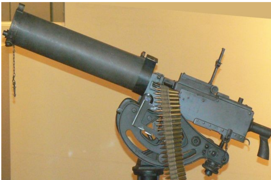
vodou chlazený kulomet M30

ovládání posádky 2 mužů, jehož střelivo může být nabíjeno buď z levé nebo pravé strany.článkový řemen je užíván k páskování nábojů, které jsou v tomto umístěny- krabicový zásobník je na 250 nábojů ráže 12.7mm. Jako protiletadlový kulomet pronikne náboj zkrze 22.2 mm pancíř na vzdálenost 100yardů( 91m) a 19mm pancíř prorazí na vzdálenost až 500m střelou BMG, která se používá i pro kulometry Maxim a Gatling. Váha kulometu je dle výbavy od 14.7 kg do 17.5kg