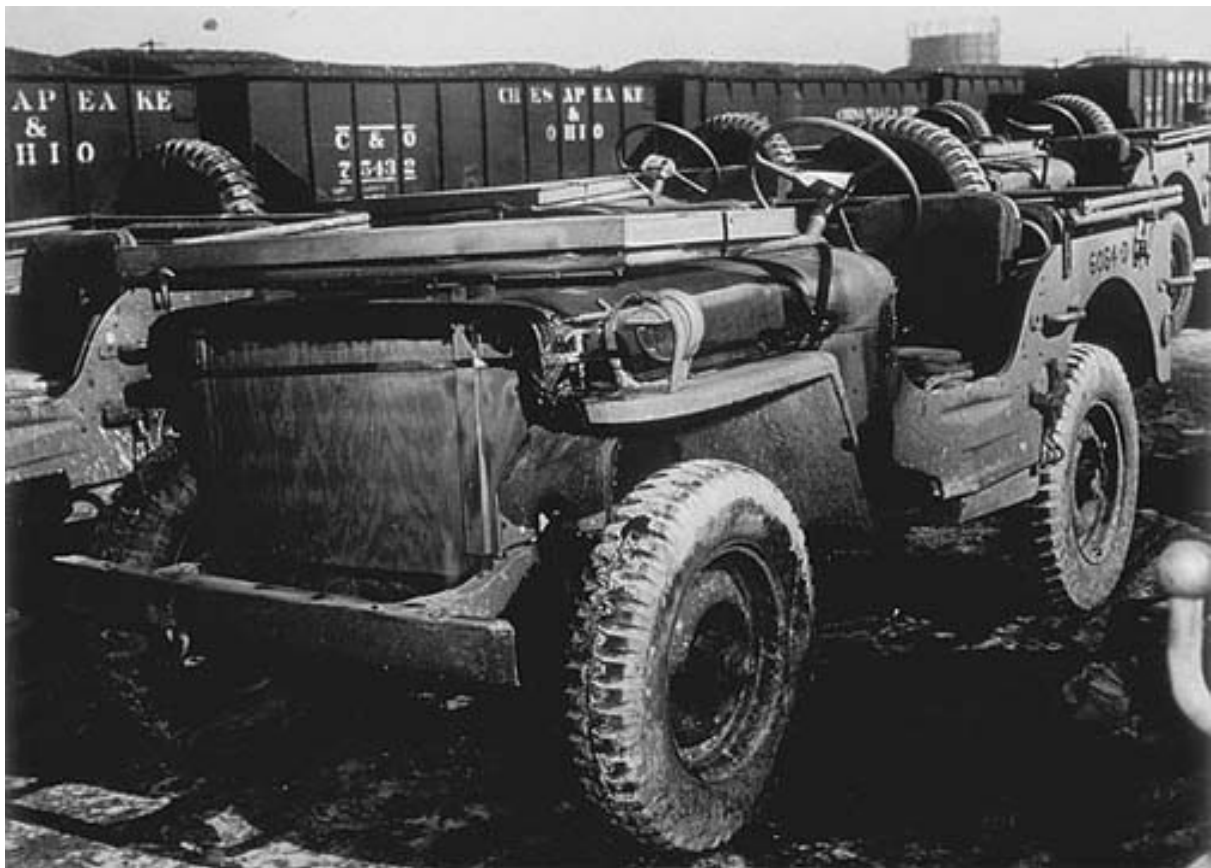
Chladič jeepu zakryt před mořskou solí, stejně jako zarámované čelní sklo.