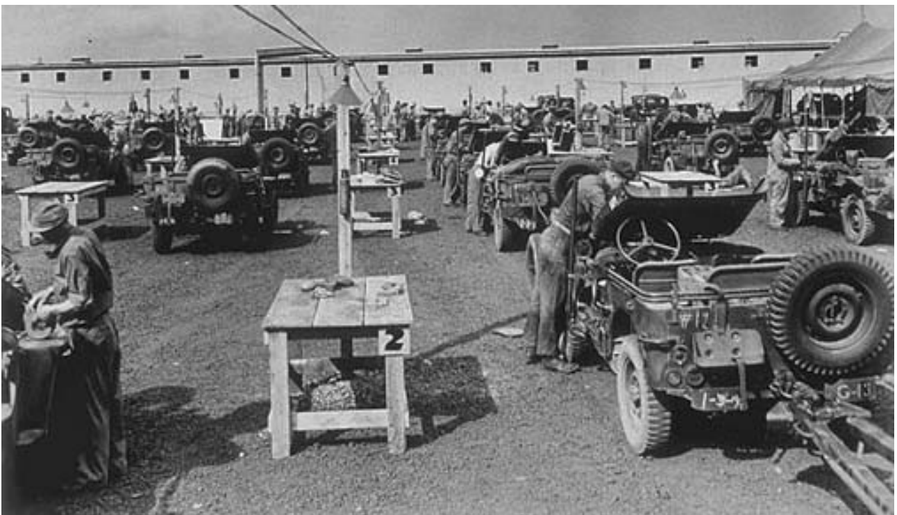
Některá modrá čísla na jeepech jsou právě z důvodu přepravy po moři, kde na místě určení se přetírala bílou barvou, protože modrá speciální barva odolávala lépe povětrnostním podmínkám.