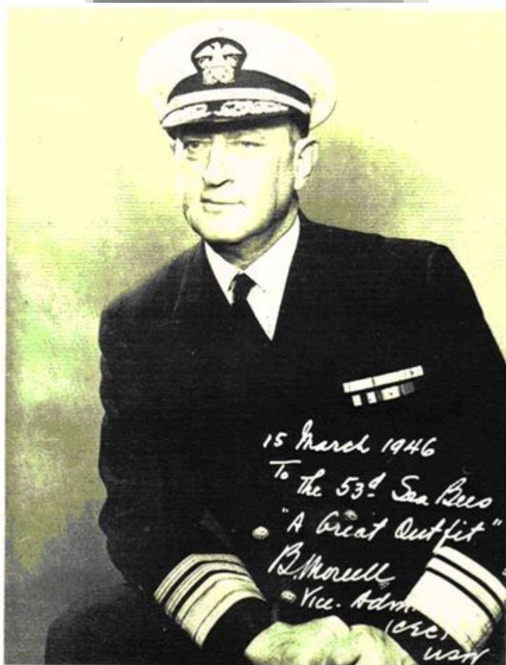
Ben Moreell admirál Seabees