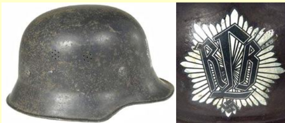
M-34 Reichsluftschutzbund (RLB)