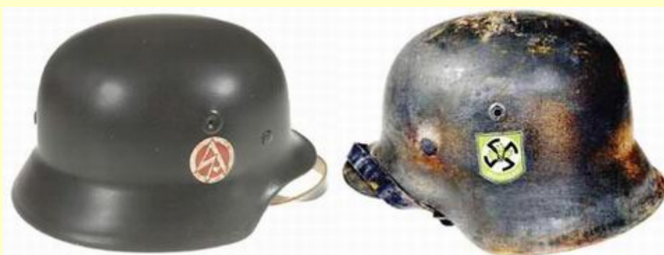
Helma Sturmabteilungen - SA a helmaVolkssturmu z let 1944-45