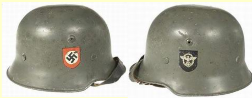
Edelstahlhelm M-34 policejní RZM - verze se zaobroubeným okrajem převzatá od armády.