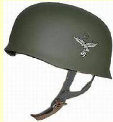
Uchycení upínacího řemenu na helmě v polní šedi