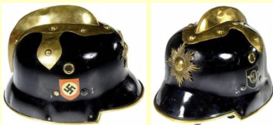
M-34 Feuerwehrpolizei - přehlídková generálská helma hasičská