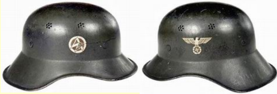
Helma typu Gladiátor I. se značením jednotek SA