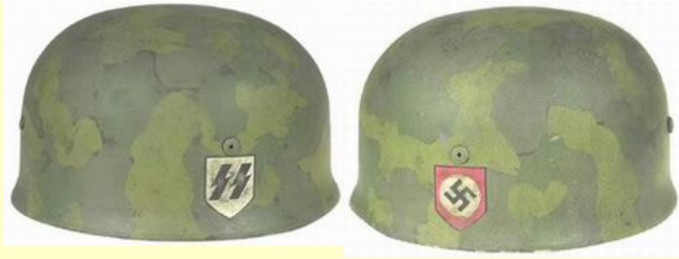
Helmy SS-Fallschirmjäger Bataillonu 500