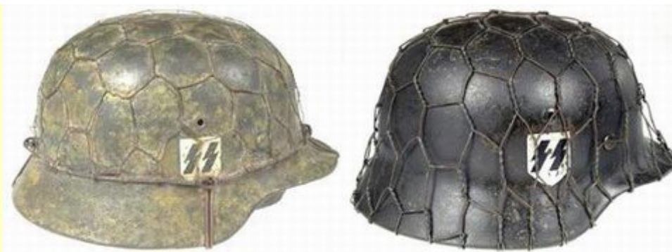
Helma SS se sítkou na foliáž vlastní výroby v okrové barvě, a to samé jen v barvě polní šedi