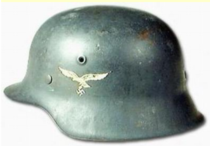
Stahlhelm M - 42

Helma typu M-42 byla shodná tvarem i větracím otvorem s helmou typu M-40. Jediný rozdíl byl v zaobroubení dolní části helmy, které již nebylo zaobroubeno do vnitřní strany helmy, ale bylo pouze zabroušeno. Helma vlastně neměla spodní lem. Výroba probíhala od roku 1942 až