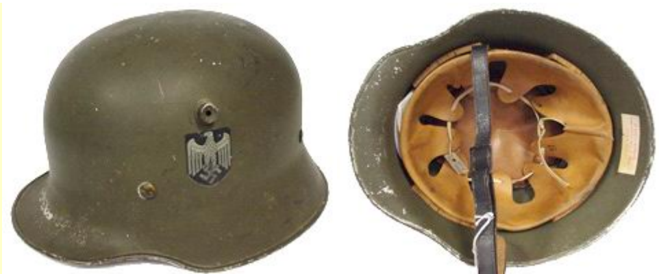
Wehrmacht Paradehelm aus Aluminium - důstojnická hliníková přehlídková helma M-1918. V pozdější době byly tyto helmy vyráběny ze skelných vláken kvůli váze.