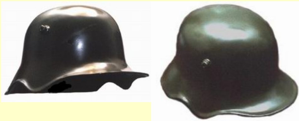
M 1918, Fernsprecher und Kavalleriehelm (helma pro telefonisty a kavalérii). Tato helma měla vykrojení na ucho a byla používána v jednotkách Reichswehru. Na začátku II. Světové války byla fasována pro dělostřelecké pozorovatele. Za I. světové války bylo vyrobeno 7,5 milionu kusů tohoto typu helmy.