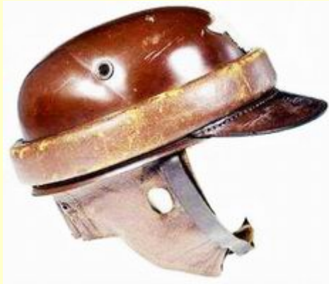
Polizei brauner Lederschutzhelm für die Motorisierte Gendarmerie