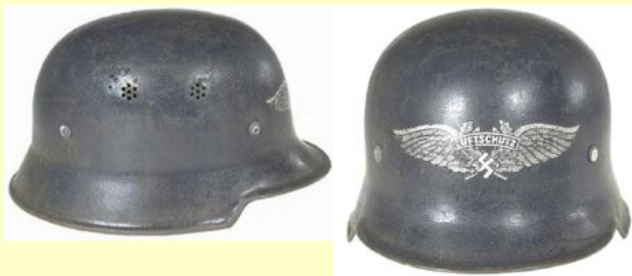
M-34 Luftschutz - protiletická obrana