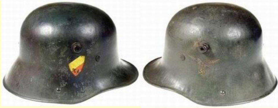
M-16 , první verze se značením Luftwaffe