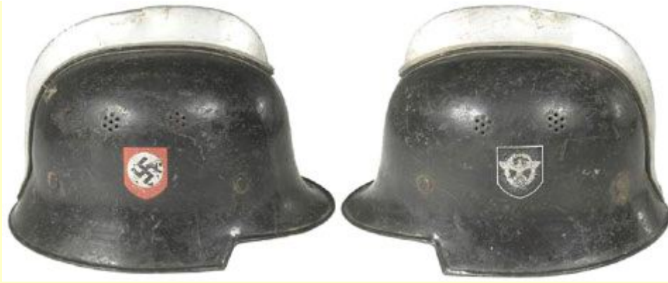
M-34 Feuerwehrpolizei - hasičská helma