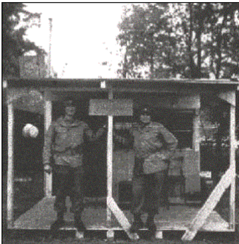
Zajatecký tábor-velitelská chata

Navrhl jsem, ať kontaktuje svého velitele sboru a poradí mu také, že by pro něj bylo daleko lepší, kdyby se vzdal celých příkazů a radši se nechal zajmout Američany spíše, než čekat na jeho vojenské jednotky, které budou chyceni Rusi. Řekl jsem mu dále, jestli jeho velitelé sboru nebyli připraveni k tomu, aby se vzdali, pak očekávám od něho, jako velitele divize, poskytnout bezpečný průchod pro mého řidiče a mě zpět do Jagersgronu, kde Američané čekají od té doby, co spadáme pod bílou vlajku příměří. Před odjezdem kontaktoval velitele sboru, který se ptal proč americké síly zastavily postup k německé armádě téměř do Československa, když měli otevřenou cestu. Mohlo to být jednodušší pro jeho divizi. Já jsem mu řekl, že jsem nevěděl nic o tom, proč jsme zastavili, ale ujišťuji, že jsme postupovali a kdyby ne, tak v tuto dobu bychom byli v bitvě o Bulge s Rusi. Zřejmě to bylo dost k tomu, přesvědčit ho kontaktovat svého generála.