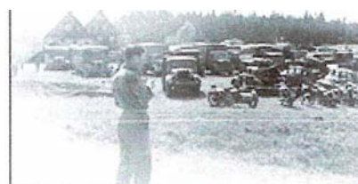
Captured German Wehrmacht