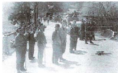
German civilians, believed to be Gestapo and Nazi Party officials, accompanying Germans troops entering Jagersgron