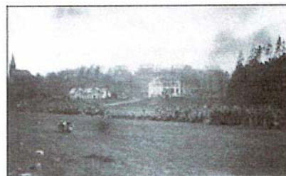
More German troops entering the. POW! G2mn