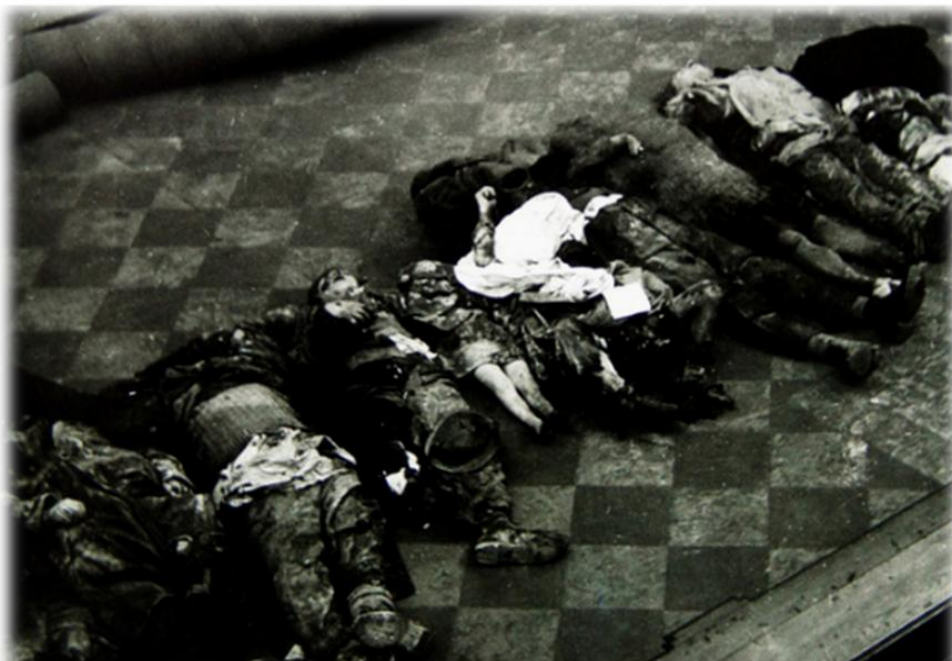
Oběti shromážděné v kostele sv. Ignáce

I když šlo „jen“ o dva nálety na Prahu, o kterých se navíc dodnes už ví spíše méně než více, ve své době představovaly z hlediska vcelku poklidného života v protektorátní Praze skutečný šok.