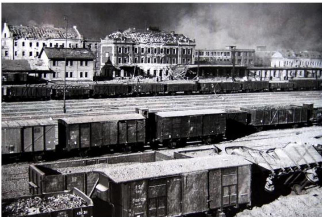
Horní nádraží v Libni

Značná část zasažených továren sloužila německému zbrojařství, přesto se dodnes vede mezi historiky diskuse o motivaci a oprávněnosti akce takové intenzity na samém konci války.