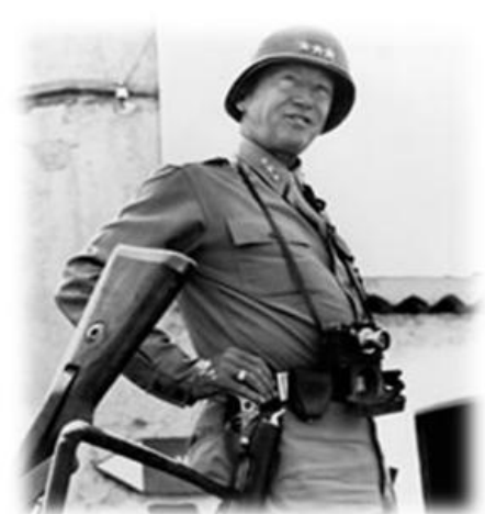
Obr. Americký generál Patton, když si prohlížel ruiny Škodovky, prohlásil: »Dobrá práce, jsem spokojený!«