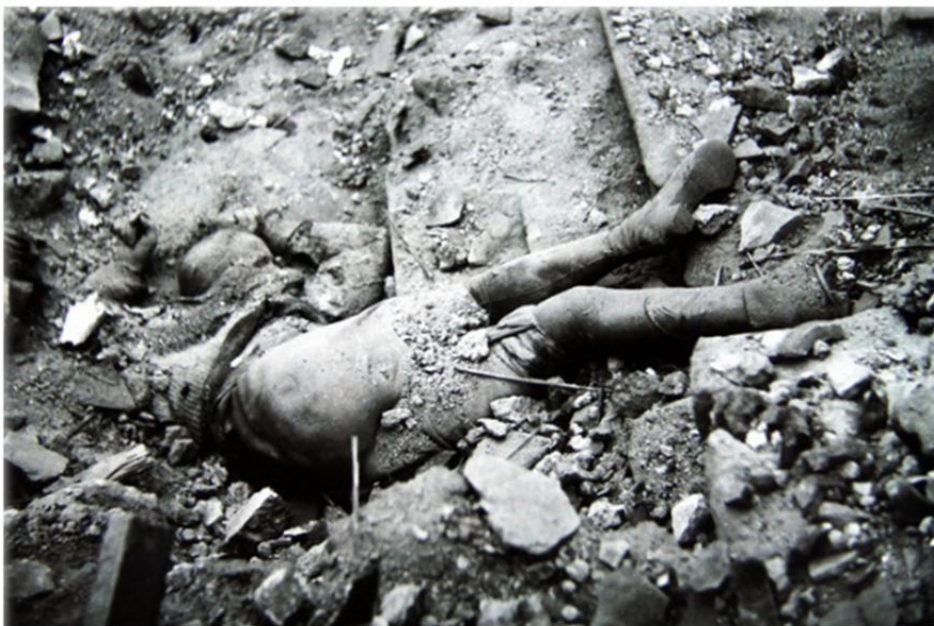
Oběti v opatství Na Slovanech