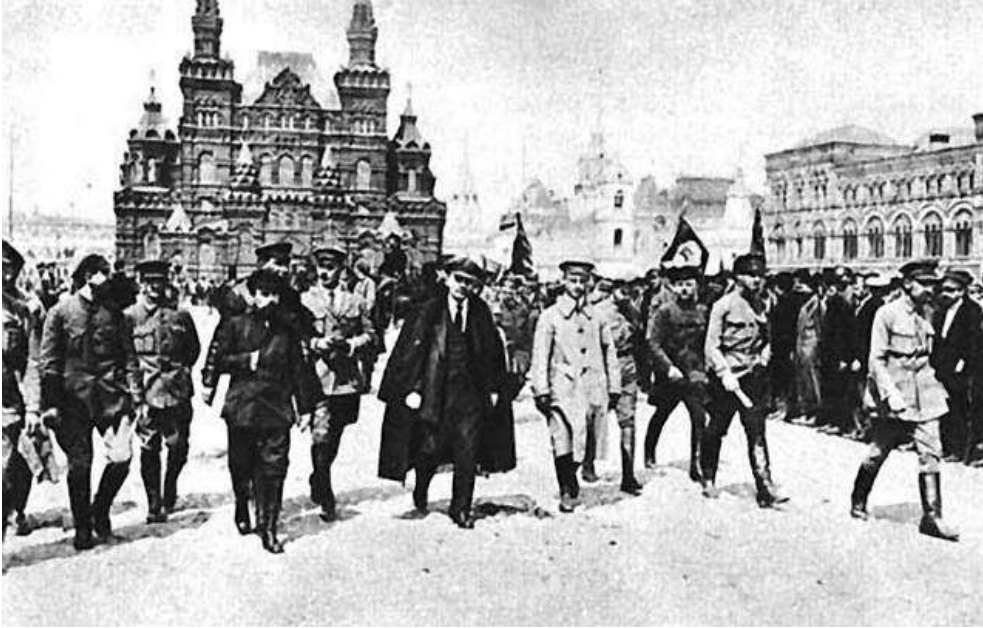
Lenin v čele bolševiků

Mnoho papírů bylo podepsáno Hansem, svobodným pánem z Wangenheimu, který je adresoval dvěma tajným agentům s krycími názvy Bankéř a Krtek . Bankéř byl ve skutečnosti Alexander Parvus a Krtek Vladimír Iljič Lenin . Ten byl styčným důstojníkem mezi Němci a ruskými agenty, a měl na starosti převod materiálu a peněz pro ruskou revoluci.