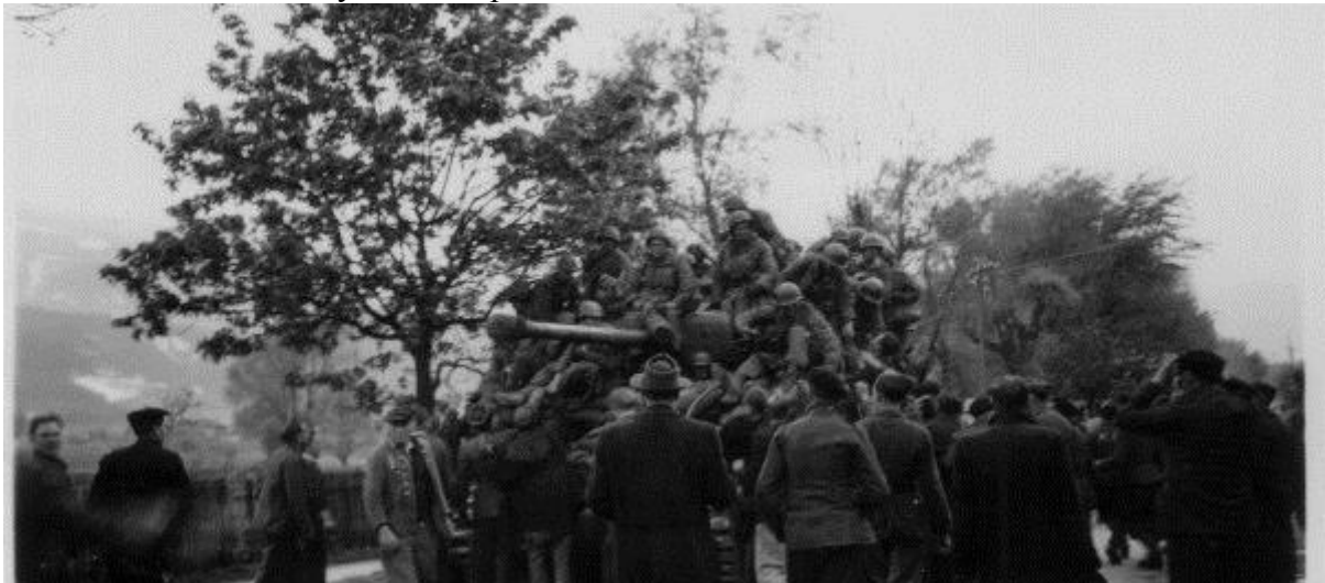
Američtí vojáci vřelé přivítání do Innsbrucku na 3.5.1945, druhý den některé z nich byly přesměrovány na Itteru. - See more at: http://www.historynet.com/the-battle-for-castle-itte.htm#sthash.PHyimw7T.dpuf