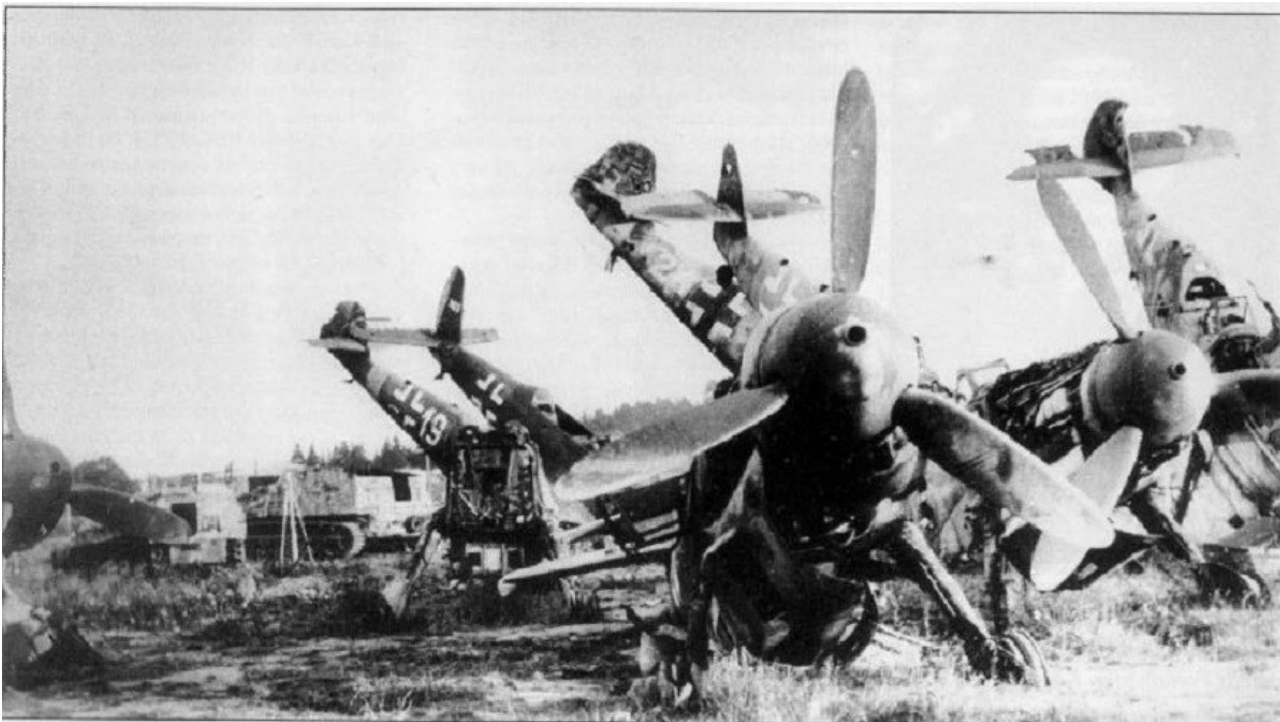
Pozostałości po JG 52 na lotnisku w Niemieckim Brodzie, maj 1945 rok. Widoczny kadłub samolotu Messerschmitt Bf 109G-10 (W.Nr 612982) „biała 24” należącego do 1. Eskadry ROA. Na samolocie widoczne oznaczenia niemieckie, numer taktyczny malowany był pomiędzy usterzeniem a krzyżem, to usytuowanie było typowe dla samolotów, na których latali Rosjanie.