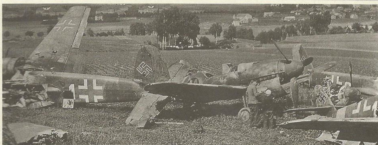
↑ Tyto zničené Bf 109G na letišti v Havlíčkově Brodě údajně patřily 5. stíhací letce ROA