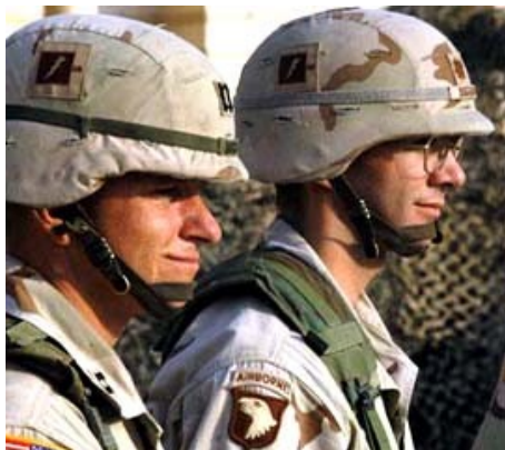
PASGT Kevlar helma -101 Airborne Iraq

barvu s bílým proužkem s nápisem MP. Další zvláštní složky měly vlastní barvou rozlišitelné helmy s nápisem. Dokonce i chromované helmy, použitelné na zvláštní příležitosti a slavnosti pro některé jednotky. Bavlněné maskovací pletivo bylo hojně využíváno v první linii, pro zasunutí větví a trávy. Armáda neměla standardní výrobu těchto až do r. 1945 (Japonsko-prosinec 1944 Evropa a tak se používala maskovací síť z jeepů a tanků. První maskovací povlak se použil pro USMC v Tarawa 1943 - zhotovený z kepru s potiskem jehličnatých stromů, který se po zvlhnutí v tropickém podnebí napnul na helmu, poté zhnědl a dokonale maskoval vojákovu hlavu.