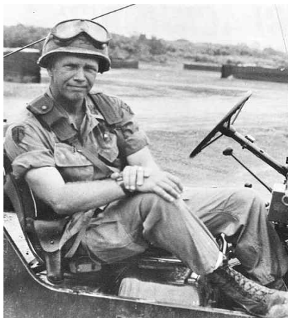
Colonel George Patton jun. - Vietnam toto je otec "našeho" Pattona, kterého potkáváme v Plzni

Výsadkové jednotky měly M-1C helmy s vypolštářovanou bradou a páskem, který držel oboje díly společně pohromadě během seskoku a pásek se ještě dal upnout ke kombinéze, z důvodu ztráty helmy. Po seskoku se tento pásek nosil zasunut za okraj helmy vzadu. Většina vojáků nosila zde i krabičky cigaret, spraye proti hmyzu (Vietnam) nebo časopisy. Ve Vietnamu bylo navíc možno maskování otočit naruby, dle situace a prostředí rostlinstva a terénu. V Korei bylo otočené maskování bílé, v zimním období.